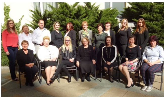
Fotografie č. 7: tým EE-COE II při setkání v Praze, 28. března 2017

V prvním čtvrtletí (od 1. února do 30. dubna 2017) se projekt EE-COE II věnoval především dokončení a podpisu grantových dohod s jednotlivými partnery a přípravě a podání projektových žádostí etickým komisím ve všech zemích. Většina zemí se snažila podat žádosti k etickému schválení v termínu do 31. května.