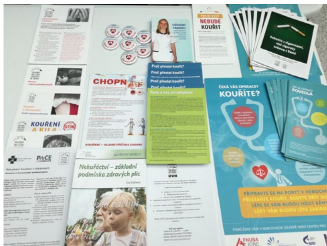
Fotografie č. 12: dostupné osvětové materiály, akce pro veřejnost, Ústřední vojenská nemocnice v Praze, 28. duben 2017

Projekt EE-COE II byl kromě toho zmíněn prof. Evou Králíkovou v tomto čtvrtletí při osmi dalších příležitostech po celé zemi (např. na celostátních zdravotnických konferencích). K distribuci byly připraveny pokyny pro sestry a další související materiály (odhadovaný celkový počet účastníků, zdravotníků, byl 600).