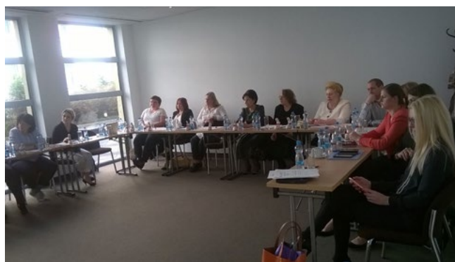
Fotografie č. 3: projekt EE-COE, zahajovací setkání, 28. března 2017