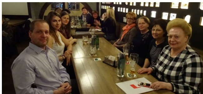
Fotografie č. 1: večeře členů projektové skupiny EE-COE, 27. března 2017

Setkání bylo skutečně pro všechny zapojené do projektu EE-COE II velmi přínosné a poskytlo nám příležitost se opět setkat s kolegy a přivítat nové partnery, členy našeho týmu, ze Slovenska, Slovinska a Moldavské republiky. Milou příležitostí pro seznámení byla i večeře v předvečer hlavní schůzky.