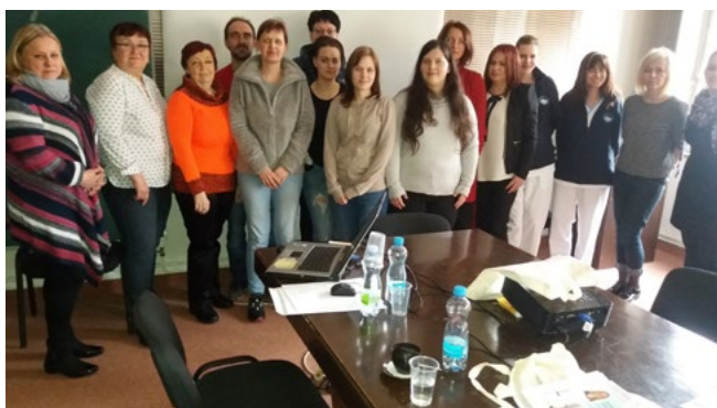
Fotografie č. 8: workshop v České republice v Praze, 8. března 2017

Zatímco většina zemí zakládala nové týmy, české vedoucí sestry pokračovaly ve vyškolování dalších nových sester. První workshop, kterého se zúčastnilo 10 sester, se konal již 8. března 2017 ve Všeobecné fakultní nemocnici v Praze. Většina z těchto sester pracuje na Pneumologické klinice Fakultní nemocnice v Motole.