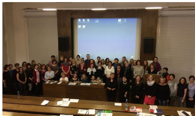
Fotografie č. 9: výroční konference SLZT pro česká léčebná centra, Praha, 6. duben 2017

6. dubna 2017 pořádalo v Praze Centrum pro závislé na tabáku pod vedením prof. Evy Králíkové každoroční jednodenní konferenci pro přibližně 40 dalších center pro léčbu závislosti na tabáku z celé České republiky. Konference (se zhruba 50 účastníky) se zúčastnily české vedoucí sestry, které informovaly o posledních dosažených výsledcích (čili o krátkých seminářích) a o dalších plánovaných aktivitách v rámci projektu EE-COE II.