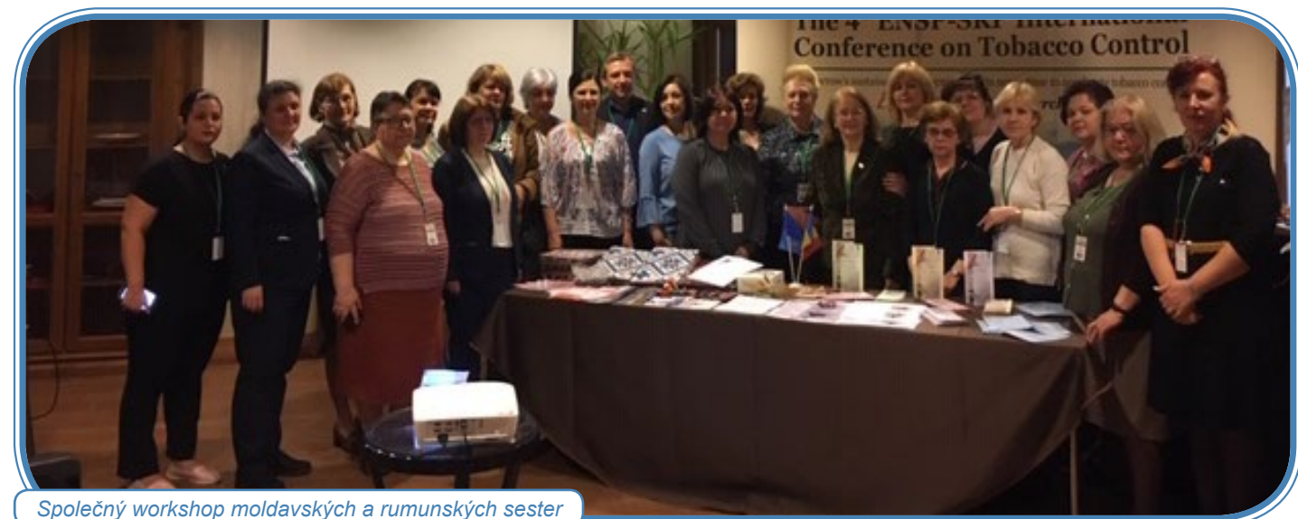
Společný workshop moldavských a rumunských sester

Na stejném místě zorganizovaly 28. března 2019 pro sestry Rumunské asociace sester a Asociace sester Moldavska společný mezinárodní workshop o kontrole závislosti na tabáku a možnostech krátkých intervencí. Zúčastnilo se celkem 28 sester, z toho 20 rumunských a 8 moldavských.