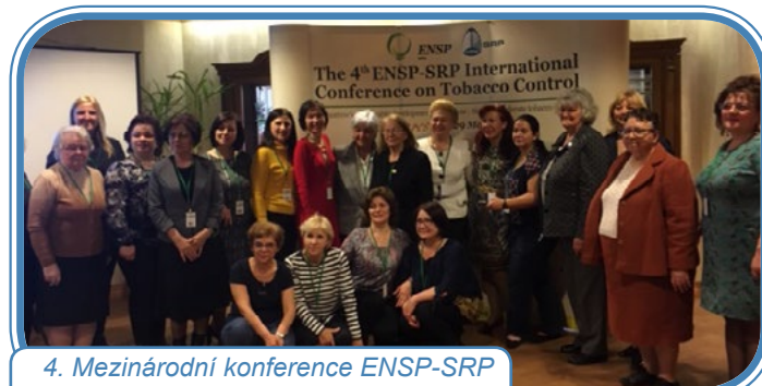
4. Mezinárodní konference ENSP-SRP o kontrole tabáku v Bukurešti

V březnu se 8 zástupkyň MR zúčastnilo 4. Mezinárodní konference ENSP-SRP o kontrole tabáku v Bukurešti. Společně s kolegyněmi z Rumunska se zúčastnily plenární sekce na téma kontroly tabáku o možnostech odvykání kouření a vlivu kouření na lidské zdraví.