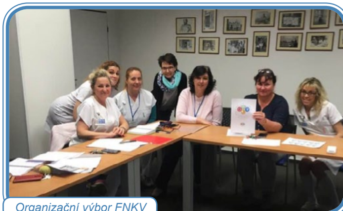
Organizační výbor FNKV

Dne 7. března 2019 se sešel tým k přípravě organizace akce pro veřejnost „ Světový den bez tabáku “ ve Fakultní nemocnici Královské Vinohrady (dále jen FNKV).