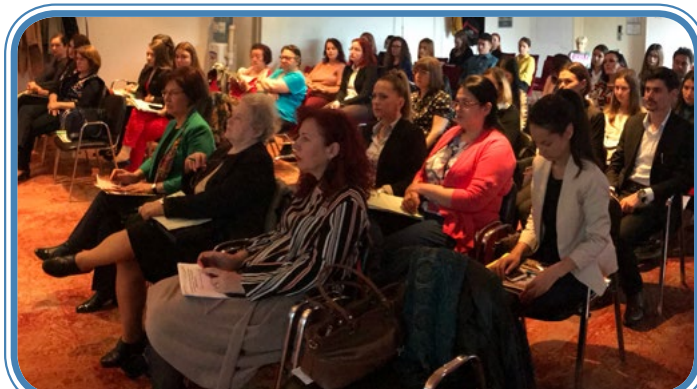
Účastnice každoroční Národní konference sester v Craiově

Velmi jsme ocenili příspěvky studentek zdravotnických škol a jejich přístup jako budoucích sester.