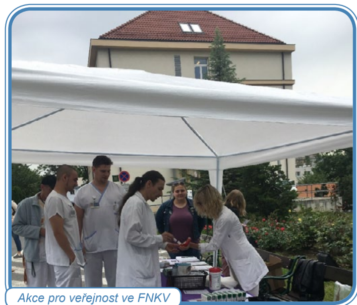
Akce pro veřejnost ve FNKV