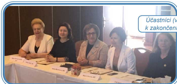
Účastníci (vč. moldavského týmu) setkání k zakončení projektu ve slovinském Bledu

5. června 2019 se Asociace sester Moldavska zúčastnila setkání k zakončení projektu ve slovinském Bledu. Na akci byla zastoupena třemi členkami Asociace sester Moldavska. Na závěrečné schůzi tohoto setkání prezentovala každá ze zúčastněných zemí svoji závěrečnou zprávu k projektu. Představily jsme plánované aktivity, své problémy a překážky, ale především přínosy projektu.