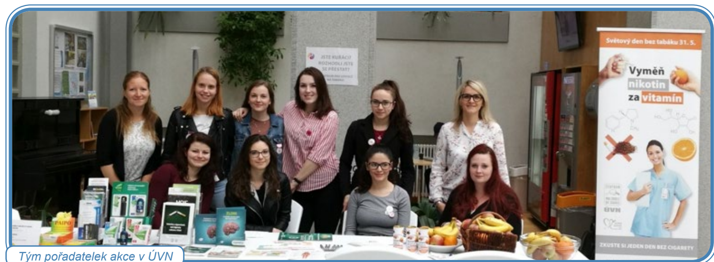
Tým pořadatelek akce v ÚVN