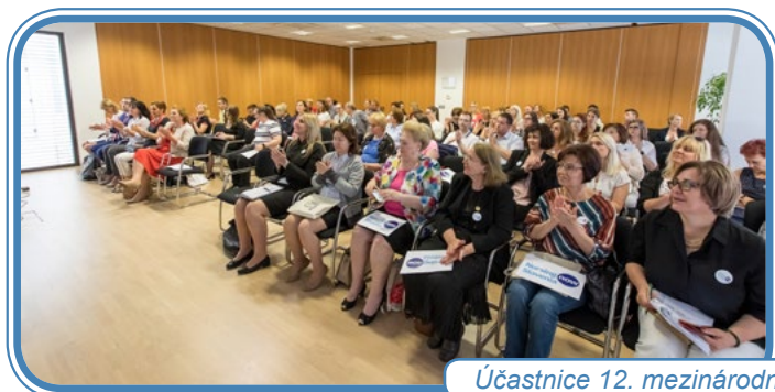
Účastnice 12. mezinárodní vědecké konference v Bledu