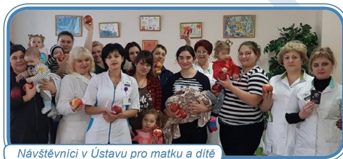
Návštěvníci v Ústavu pro matku a dítě

Dalšími důležitými akcemi byly krátké semináře pořádané Ústavem pro matku a dítě pro maminky s dětmi různého věku . Naše školitelky s maminkami diskutovaly a poskytovaly jim informace o nebezpečnosti kouření pro dospělé a možnostech prevence kouření u dětí.