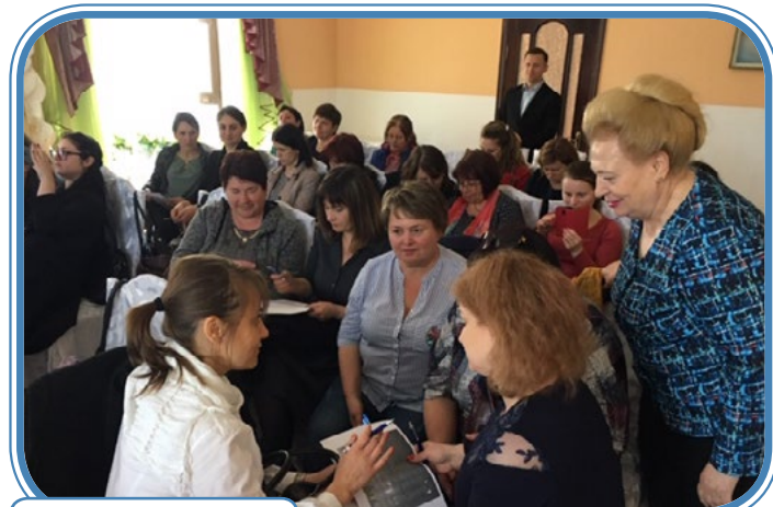
Workshop a diskuse

20. března a 18. dubna 2019 pořádal náš dvoučlenný tým workshopy pro praktické sestry na jihu země (Cahul a Comrat). Celkem oslovili na 70 účastníků.