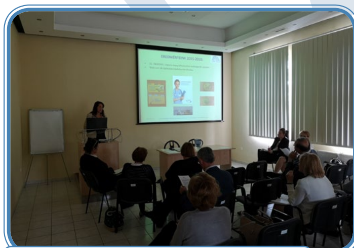
Workshop II a diskusní fórum o strategii zdravotnictví