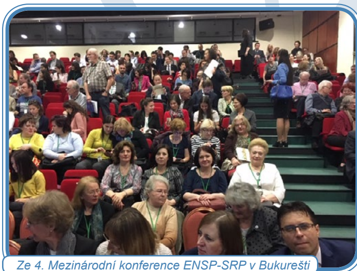
Ze 4. Mezinárodní konference ENSP-SRP v Bukurešti

Na stejném místě zorganizovaly 28. března 2019 pro sestry Rumunské asociace sester a Asociace sester Moldavska společný mezinárodní workshop o kontrole závislosti na tabáku a možnostech krátkých intervencí. Zúčastnilo se celkem 28 sester, z toho 20 rumunských a 8 moldavských.