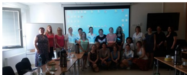
Fotografie č. 6: seminář v Pelhřimově 30. května 2017

Iveta Nohavová přednášela na Mezinárodní konferenci o kontrole tabáku 2017, pořádané Evropskou sítí pro prevenci kouření (European Network for Smoking and Tobacco Prevention, ENSP) v Řecku v Aténách ve dnech 24. – 26. května 2017, na téma „Vzdělávání sester ve východní Evropě“. Byla to rovněž výjimečná příležitost pro získávání kontaktů a sdílení zkušeností.