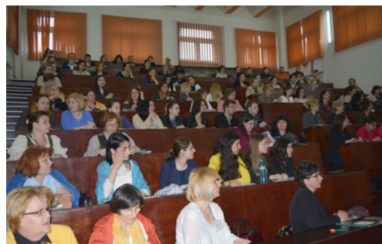
Foto 17: Účastníci národního sympozia u příležitosti Mezinárodního dne sester v Temešváru