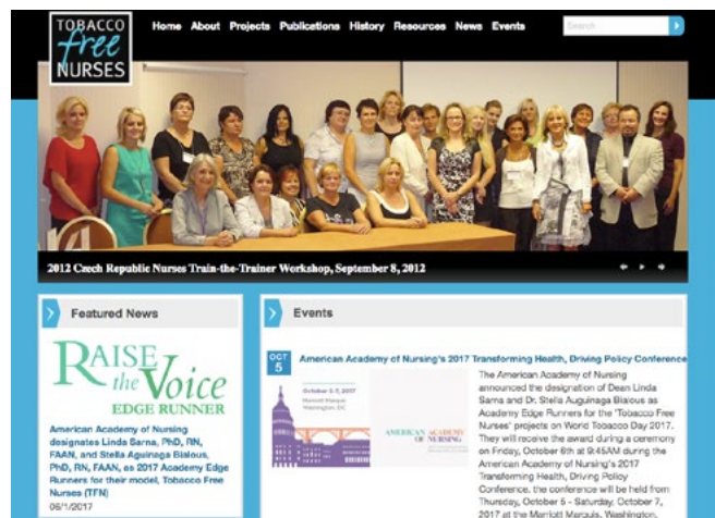
Fotografie č. 1: webové stránky projektu Sestry-nekuřačky – oznámení na hlavní stránce ( https://tobaccofreenurses.org )

Celý tým EE-COE II upřímně děkuje Stelle a Lindě za jejich neutuchající a významnou práci ve vzdělávání v oblasti odvykání kouření; za to, že poskytují prostředky zdravotním sestřím vykonávajícím praxi i pacientům; za to, že podporují sestry a jejich klíčovou roli v prosazování nekuřácké společnosti. Jsou skvělými vzory pro mnoho a mnoho zdravotních sester na celém světě!