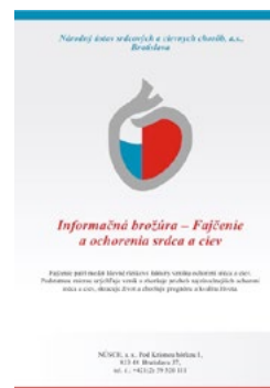
Fotografie č. 14: titulní strana brožury pro pacienty

Národní ústav pro srdeční a cévní onemocnění vydal brožuru pro pacienty s kardiovaskulárním onemocněním o účincích užívání tabáku a kouření. Jejím spoluautorem je p. Gabriel Bálint, poradce projektu EE-COE.