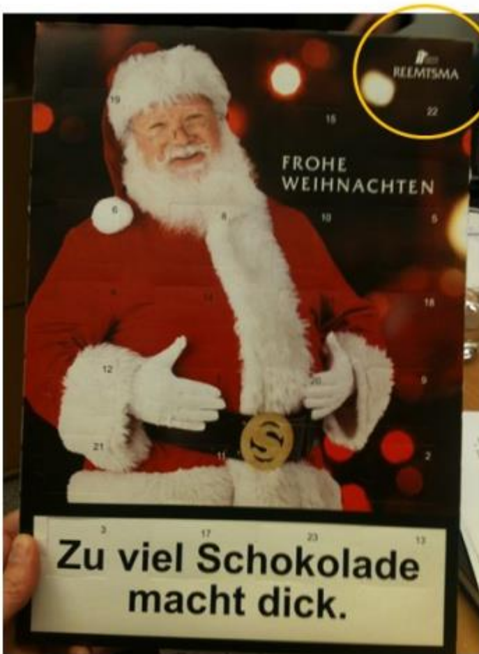
2013 Chocolate Advent Calendar 'Too much chocolate makes you fat' (English translation from German)