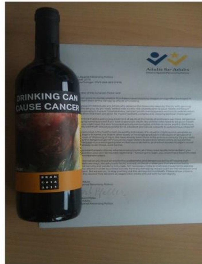
Bottle of wine 'Drinking can cause cancer'