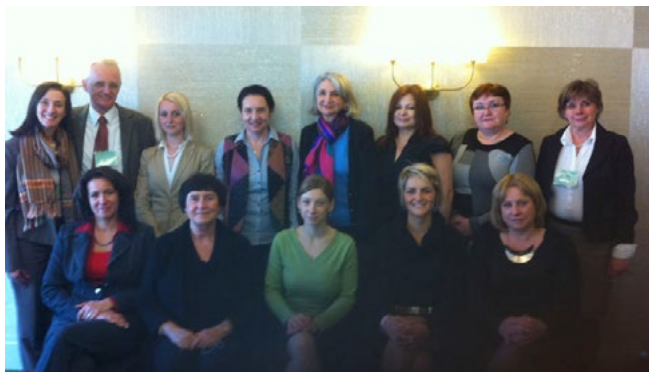
14. – 15. duben 2014 – První setkání sester z ISNCC, z pražského Centra excellence a ze Slovenska, Slovinska, Maďarska a Rumunska