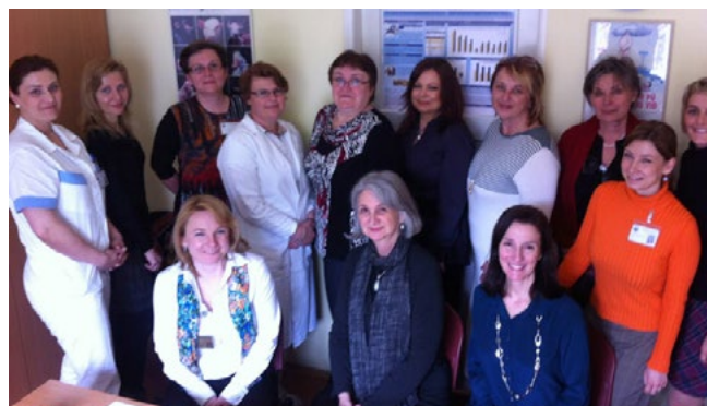
16. březen 2014 – Centrum excellence bylo ustaveno při Centru pro závislé na tabáku III. interní kliniky 1. lékařské fakulty UK a Všeobecné fakultní nemocnice